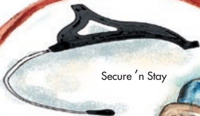
Secure 'n Stay